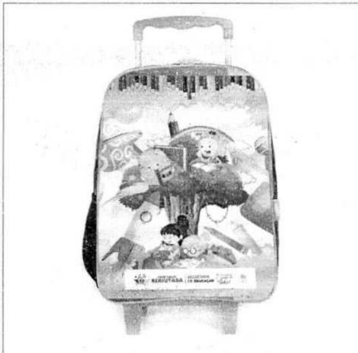
MOCHILA INFANTIL MODELO RODINHA