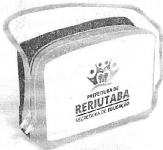
BOLSA PARA PROFESSOR

Prefeitura Municipal de Reriutaba CNPJ: 07.598.667/0001-87