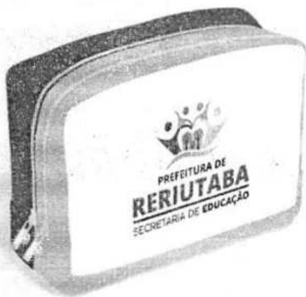
ESTOJO ESCOLAR PARA DOCENTE