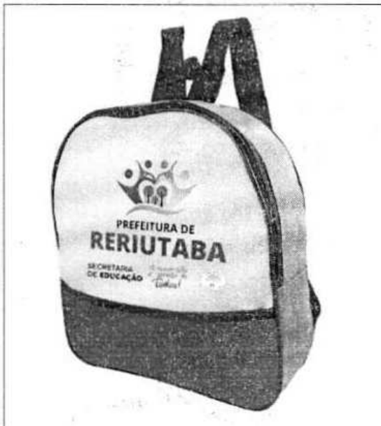
MOCHILA MÉDIA E GRANDE

Prefeitura Municipal de Reriutaba CNPJ: 07.598.667/0001-87